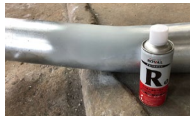
Pembaikan dengan menggunakan ROVAL