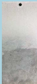
หลังทาได้ 3 เดือน