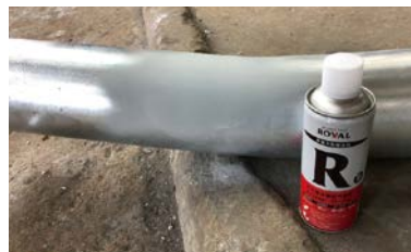
ซ่อมแซมด้วย ROVAL