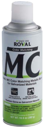
แบบสเปรย์ 420 มิลลิลิตร

MC สเปรย์ เป็นสีที่เหมาะสมสำหรับใช้คู่กับวัสดุชุบสังกะสี และสำหรับการซ่อมรอยต่างหรือการซ่อมสี ROVAL