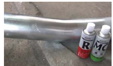
ใช้ MC สำหรับงานตกแต่งสี