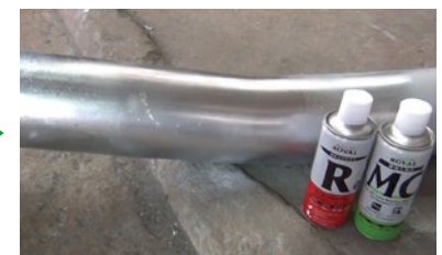
Gunakan ROVAL MC untuk warna yang