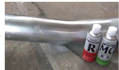
Aplicar ROVAL MC para Igualar el Color