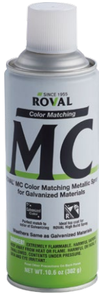
ROVAL MC Color Matching Metallic Spray for Galvanized materials

Spray Metálico con Igualación de Color ROVAL MC para Materiales Galvanizados, Ideal para Igualar Colores Después de la Galvanización por Inmersión en Caliente y para Ocultar Imperfecciones o Reparaciones ROVAL.