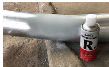
Repara con ROVAL