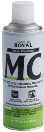
ROVAL MC Color Matching Metallic Spray for Galvanized materials

ROVAL MC สเปรย์ เป็นสีที่เหมาะสมสำหรับใช้คู่กับวัสดุชุบสังกะสี และสำหรับการซ่อมรอยต่างหรือการซ่อมสี ROVAL