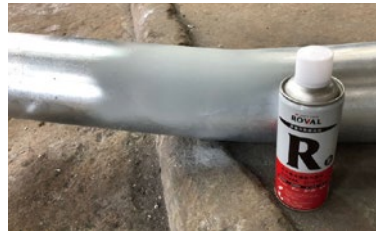
ซ่อมแซมด้วย ROVAL