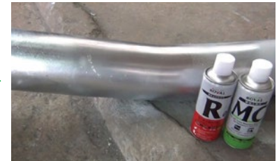
ใช้ MC สำหรับงานตกแต่งสี