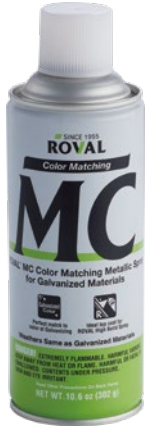
ROVAL MC Color Matching Metallic Spray for Galvanized materials

ROVAL MC สเปรย์ เป็นสีที่เหมาะสมสำหรับใช้คู่กับวัสดุชุบสังกะสี และสำหรับการซ่อมรอยต่างหรือการซ่อมสี ROVAL