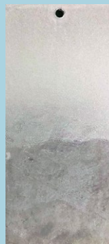
หลังทาได้ 3 เดือน